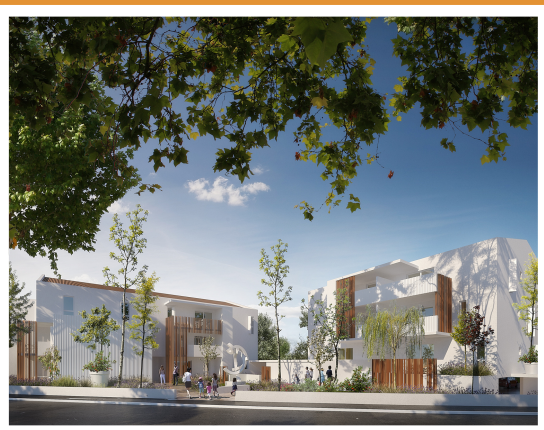
Les Jardins de la Collégiale, SERIGNAN