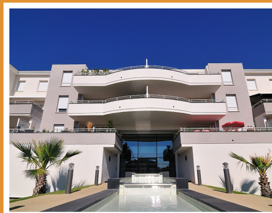
Le quai des canottes* VALRAS